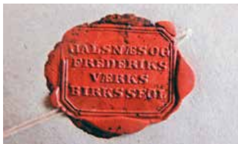
Segl fra protokollen.

Andersen og Esbjørnsen erklærede begge at intet, hverken båd eller last var assureret.