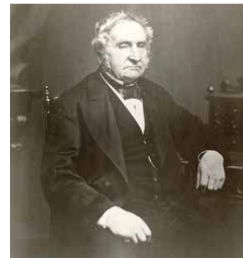
Skibsklarereren Marstrand.

hvor den blev trukket op. Efter nogen uenighed erklærede skipperen sig for strandet, hvilket betød at skib og last skulle sælges på auktion. De tre strandede rejste straks efter af politimesteren at have fået udbetalt rejsepenge.