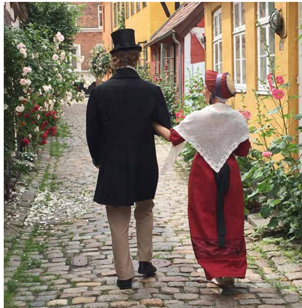
Folk fra 1801 i Helsingørs gader.

Har du lyst til at være med til at levendegøre Helsingør som Sundtoldsby? Gennem mindre events i byrummet med levendegjort formidling i historiske drag-