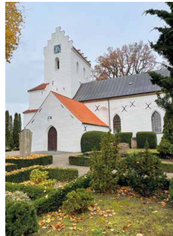
Lyderslev Kirke. November 2021.